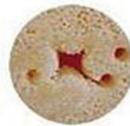
Inserción con cuchilla Helicoidal